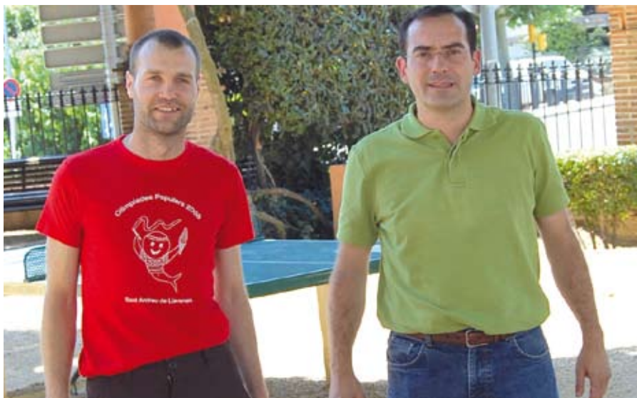
El tècnic i el regidor de l'àrea, a Ca l'Alfaro.

La Regidoria d'Esports també coordina el calendari d'utilització de les instal·lacions amb els clubs esportius que les ocupen durant la temporada regular, com són el CE Llavaneres, el Club Bàsquet Llavaneres i els veterans de futbol sala.