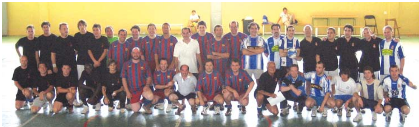
Les penyes de Llavaneres agermanades per una causa solidària.