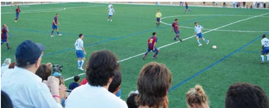
Les graderies van quedar plenes a vessar el dia de la inauguració.