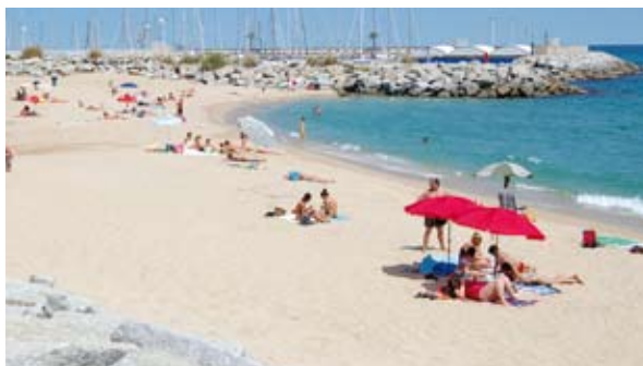
La platja de Llavaneres compta amb tots els serveis.

L'aigua del mar conté fins a 75 elements que són beneficiosos per al nostre organisme. Cal tenir en compte, però, els accidents per ofegament o per tall de digestió. Els símptomes d'un tall de digestió són el mareig, les nàusees, els vòmits, les rampes, les esgarrifances, la pal·lidesa, el pols dèbil, la inconsciència i l'aturada cardíaca. Altres accidents marítims que poden produir-se són els atropellaments per taules de windsurf o per les llanxes dels practicants d'esquí nàutic i les lesions causades per les hèlixs de motos aquàtiques i petites embarcacions.