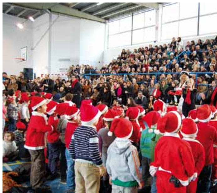
Concert de Nadal de l'Escola Sant Andreu