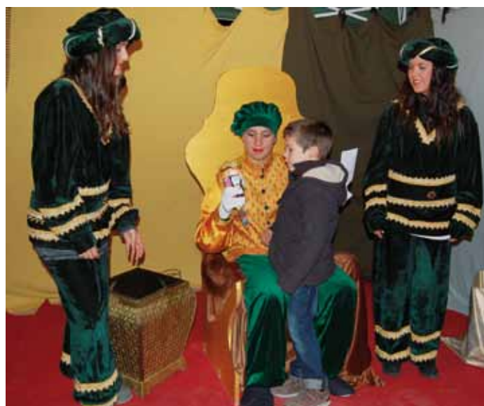
Visita dels Patges Reials