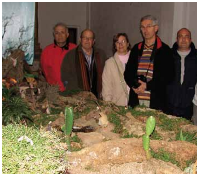
Pessebre de l'ermita de Sant Sebastià