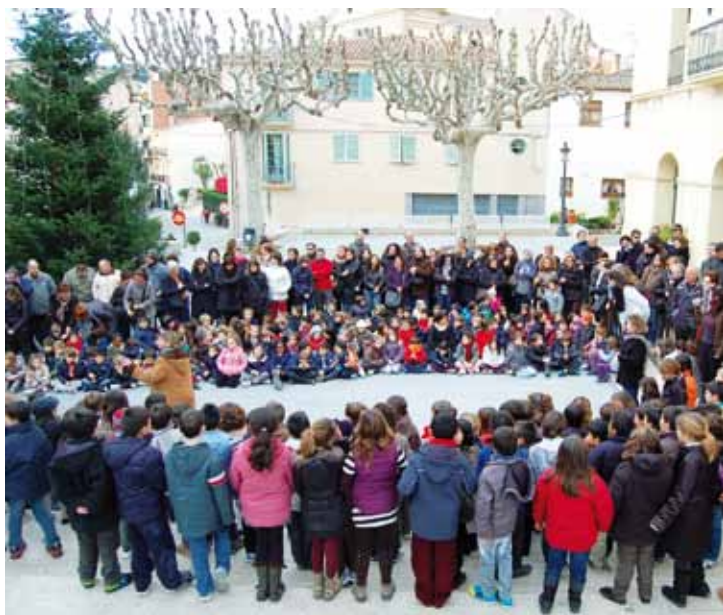
Concert de Nadal de les 3 escoles de primària