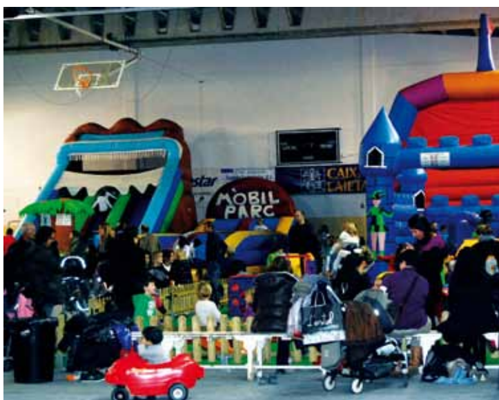
Parc de Nadal