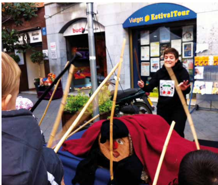
Fira de Nadal i caga tió popular