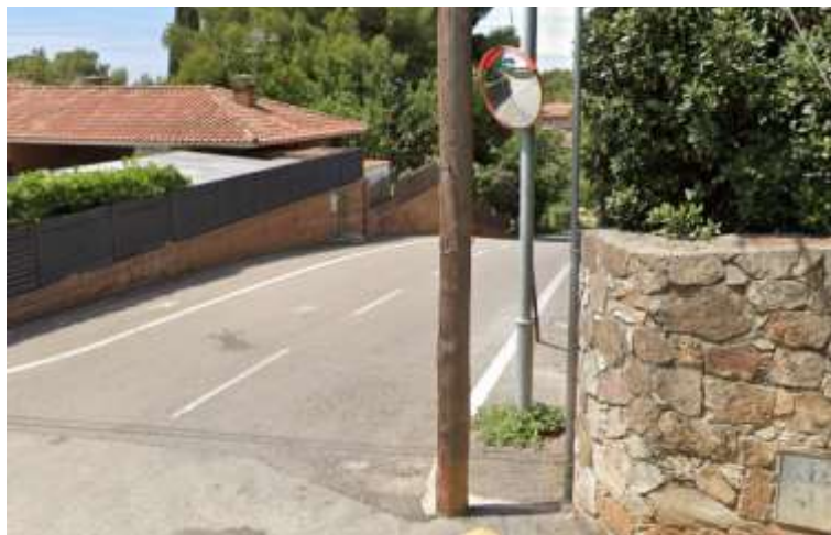
Mirall al qual fa referència la qüestió.

Es tracta d'un mirall que està tapat per un pal de llum i quan es va en direcció contrària s'ha de treure molt el cotxe per poder tenir visibilitat.