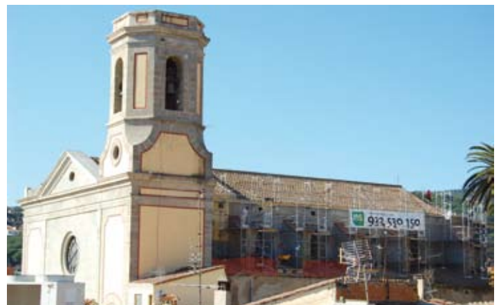
Una de les façanes laterals del temple.

comptes que té oberts a "la Caixa" i Caixa Laietana. A finals d'octubre, per recollir fons, es va organitzar un concert al temple parroquial. La iniciativa es vol repetir de cara a la primavera, amb un actuació de gospel.