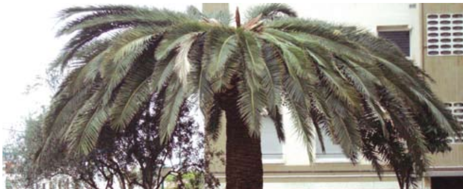
Una de les palmeres afectades pel morrut.

A mitjan novembre, es van detectar a Llavaneres els dos primers casos de la plaga del morrut de les palmeres que afecta la comarca del Maresme des de la tardor de l'any passat. En ambdues ocasions, els veïns afectats van posar-se en contacte amb els Serveis Tècnics Municipals, que després d'una primera inspecció van sol·licitar la visita d'experts en la matèria. De l'eradicació de la plaga, se'n fa càrrec el departament d'Agricultura, Ramaderia i Pesca (DARP) de la Generalitat, a través de l'empresa Forestal Catalana. La conseqüència d'aquesta plaga és que quan una palmera resulta