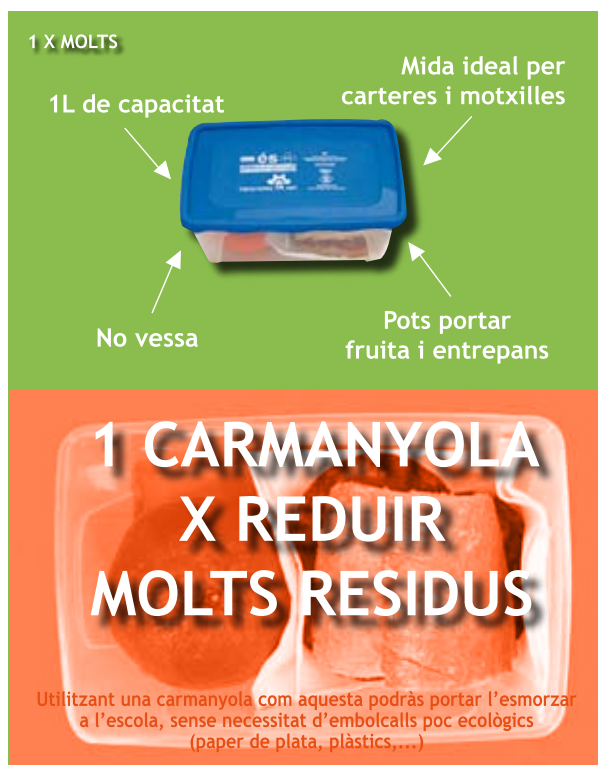
Imatge de la campanya de reducció de residus

Paral·lelament, la Regidoria de Medi Ambient té a punt una altra campanya de conscienciació ciutadana per millorar la qualitat de la matèria orgànica que es recull a Llavaneres. En aquests moments, l'Ajuntament està recollint de manera selectiva el 60% de les escombraries que es generen a la població, però la qualitat de la matèria orgànica és millorable – les dades del segon trimestre de 2007, revelen que encara hi ha un 12% d'impropi –. Com en el cas de la reducció de residus, l'Ajuntament compta amb subvencions supramunicipals, per tirar endavant la iniciativa, la qual inclourà tres actuacions: el repartiment de bosses comercials compostables, la realització de tallers de com-