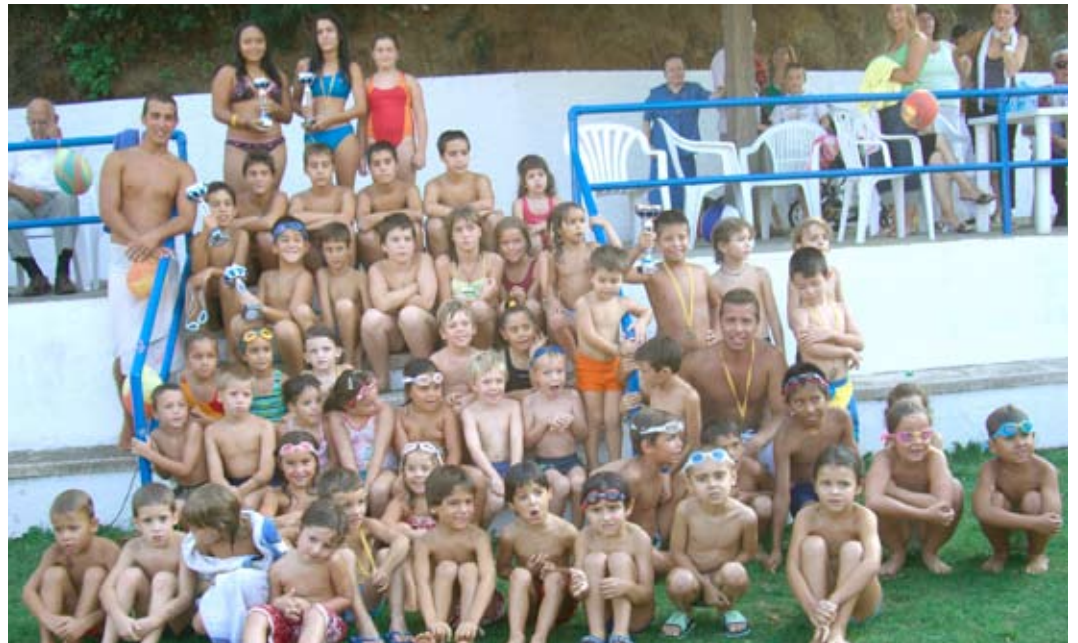
Els alumnes i monitors, en la festa de cloenda.

Els alumnes dels cursos de natació que organitzen la Regidoria d'Esports i Fels & Eis, celebren la cloenda de la temporada