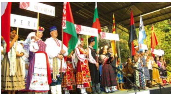
Les diverses delegacions, amb les seves banderes.

nuar amb una cercavila i, després de l'espectacle, es va oferir un sopar de germanor, amb el corresponent intercanvi de regals i de lliurament de plaques commemoratives. Ja fa 16 anys que Llavaneres col·labora amb aquestes jornades de cultura popular que organitza l'Adifolk.