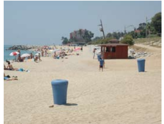
Panoràmica de la platja.