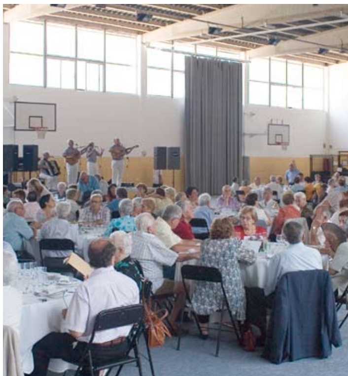
Un moment de la festa.