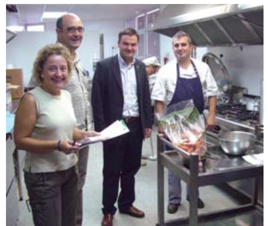
La nova cuina del CEIP Sant Andreu