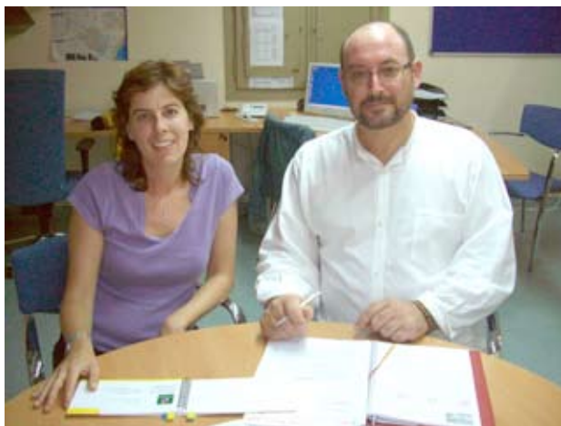
La tècnica i el regidor de l'àrea.

Altres reptes fixats per la Regidoria són canalitzar i gestionar les peticions i informacions dels col·lectius veïnals i de les associacions, així com promoure l'Administració digital.