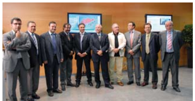
Un moment de la presentació del nou canal de televisió.

Aquest estiu, la Regidoria de Sanitat ha fet una important inversió en equipaments per a les platges: binocles, ràdios i aparells de comunicació; kits de primers auxilis; mobiliari d'atenció mèdica... A més, s'han fet campanyes informatives de promoció de la salut, especialment per prevenir afeccions i accidents (insolacions, meduses...) Igualment, s'han definit els usos dels diferents espais de la platja per tal de distingir les zones de bany de les de circulació de motos d'aigua i barques, així com els espais considerats no aptes per al bany per problemes d'accés.