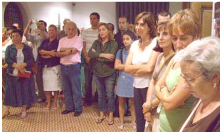
A dalt, intervenció del director del Museu, amb les autoritats. A baix, detall del públic assistent.