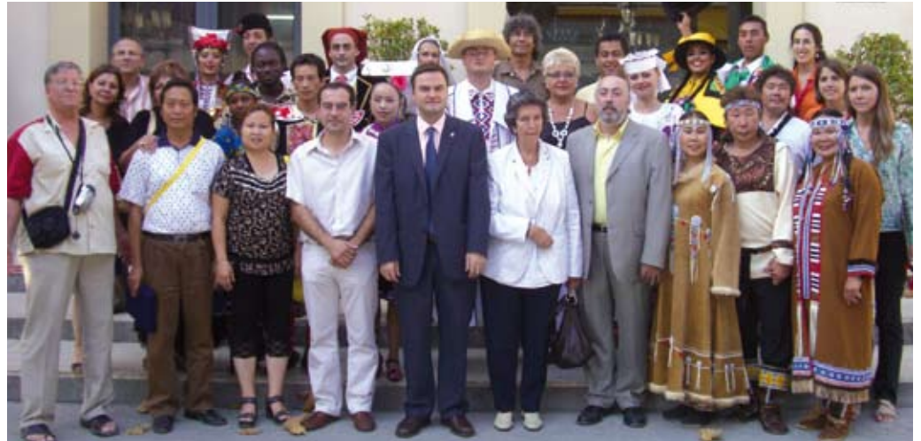
Recepció dels participants en les Jornades Folkòriques.

Ja ha passat l'estiu. Els nens i nenes han tornat a les aules i a la casa de la vila ja tenim a ple funcionament el nou curs polític. El mes de setembre que deixem enrere ha estat el preludi del calendari de feina tan atapeït que el nou govern municipal s'ha fixat per reactivar i resoldre temes pendents.