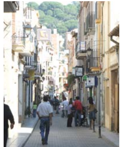
Vista del carrer de Munt, el més comercial de Llavaneres.