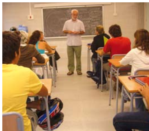
Alumnes de l'IES Llavaneres fent classe

Cal destacar també que durant l'estiu l'Ajuntament ha portat a terme un intens programa de manteniment a tots els centres, amb adequacions de pintura, fusteria i lampisteria, entre d'altres, per deixar a punt les aules. Altres millores, com la proposta de fer un hort al CEIP Labandària o arreglar-hi el pati, són projectes per a aquests primers mesos de curs.