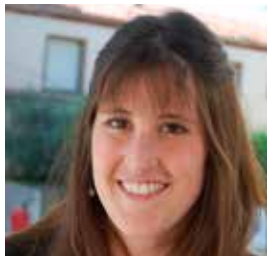
Gemma Martín. ERC Cap de Serveis a les Per- sones/ 3a Tinent d'alcalde i regidora de Benestar Social i Salut Pública