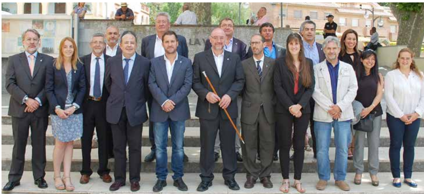
Foto de família dels nous regidors i regidores del consistori

El republicans governaran en coalició amb Acord per Llavaneres