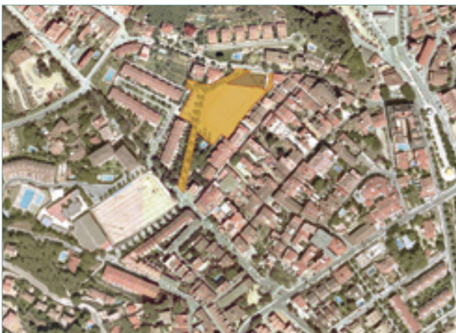
En color groc, la zona que esdevindrà passeig de vianants.

El futur passeig es convertirà en un espai de circulació per a vianants i amb jocs infantils per als més petits. A més, es col·locarà una escultura al passeig d'accés a la biblioteca i un llac separarà aquesta zona del parc.