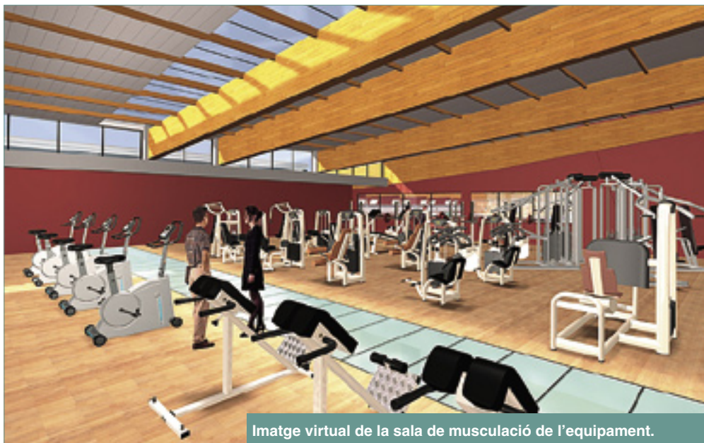
Imatge virtual de la sala de musculació de l'equipament.

Els nous equipaments se situaran a la finca dels Ametllers i ocuparan més de 31.000 m 2 . S'oferirà un ampli ventall d'instal·lacions esportives equipades amb tot tipus de serveis i possibilitats. De moment, l'Ajuntament busca l'opinió d'entitats esportives i socials.