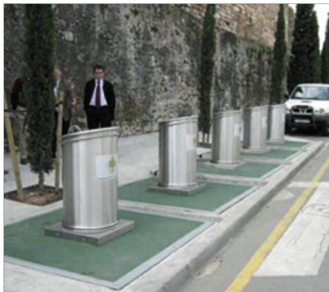
El soterrament dels contenidors és una de les novetats.

Al mateix temps, el nou contracte amb l'empresa Fomento de Construcciones y Contratas, SA, implicarà que aquesta es faci càrrec de la compra de noves màquines i camions de recollida i que faci la neteja que fins ara ha fet la brigada municipal.