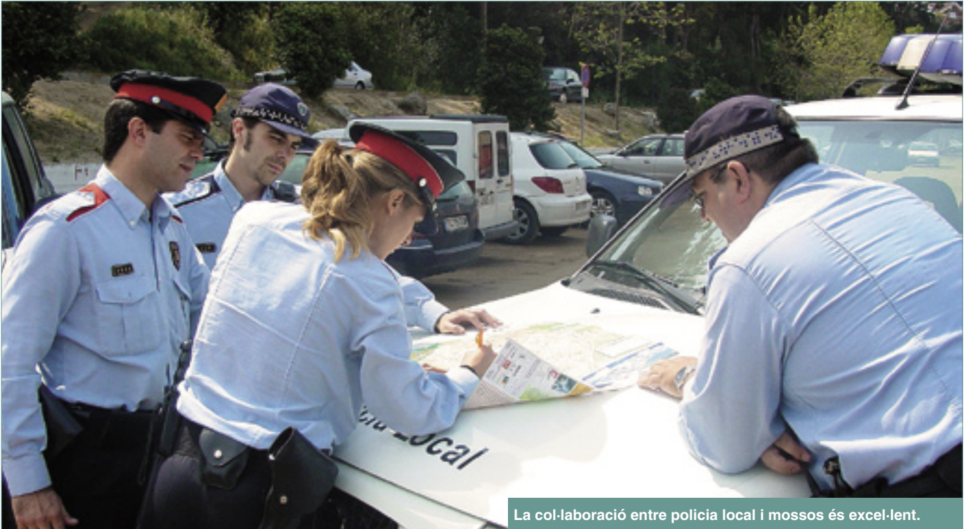
La col·laboració entre policia local i mossos és excel·lent.

a terme una detenció per faltes penals en una acció contra el patrimoni públic.