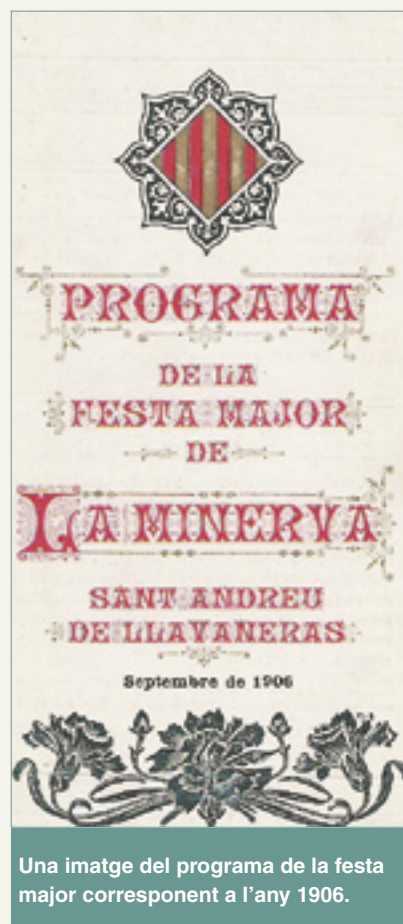
Una imatge del programa de la festa major corresponent a l'any 1906.

Tradicionalment s'ha celebrat aquesta festa el tercer diumenge de setembre però des del 1932 fins al 1941 es va celebrar a l'agost. Va ser a partir de l'any 1970 quan, de comú acord entre la parròquia i l'Ajuntament, es va traslladar la Festa Major de la Minerva al tercer diumenge de juliol, tal com la celebrem ara.