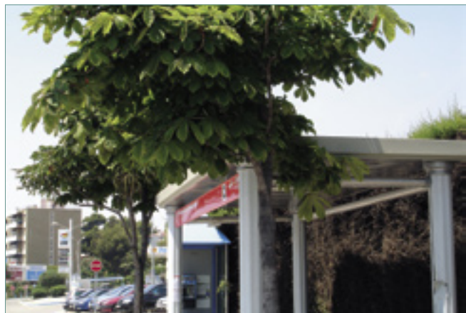
La nova marquesina situada davant de l'estació de RENFE.

El cap de setmana continua com fins ara: el primer autobús del centre surt a les nou del matí i l'últim a les vuit del vespre. A