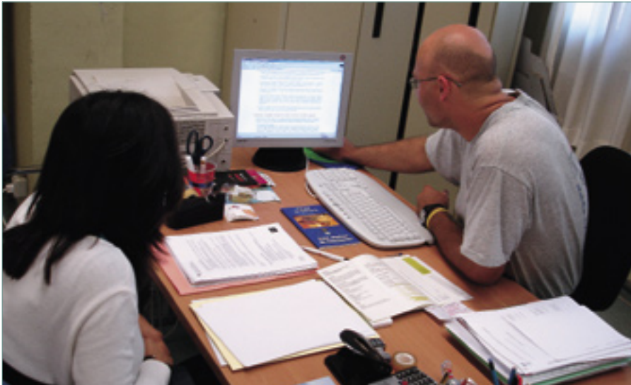
El PIJ és un punt d'informació i assessorament dirigit als joves.

Amb el 2005 el servei el PIJ ha millorat en serveis i qualitat. A més d'impulsar el carnet d'usuari, els joves comptaran amb un nou local a Can Riviere.