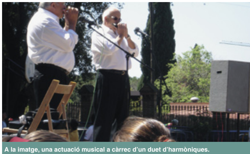
A la imatge, una actuació musical a càrrec d'un duet d'harmòniques.