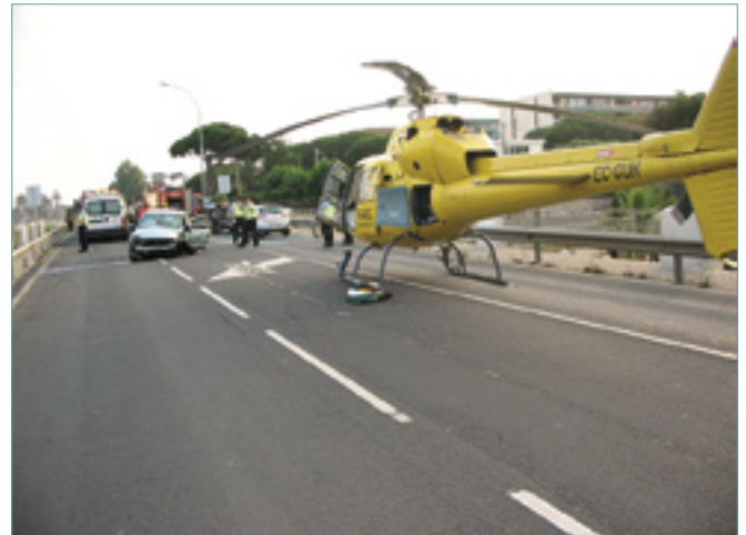
Actuació policial per un accident a la N-II aquest juny.

La dinàmica ha sigut qualificada d’un “gran salt qualitatiu i quantitatiu” des de l’Ajuntament. Precisament, un altre aspecte que augmenta són les implicacions i competències de les administracions locals, cada vegada amb més poder de decisió.