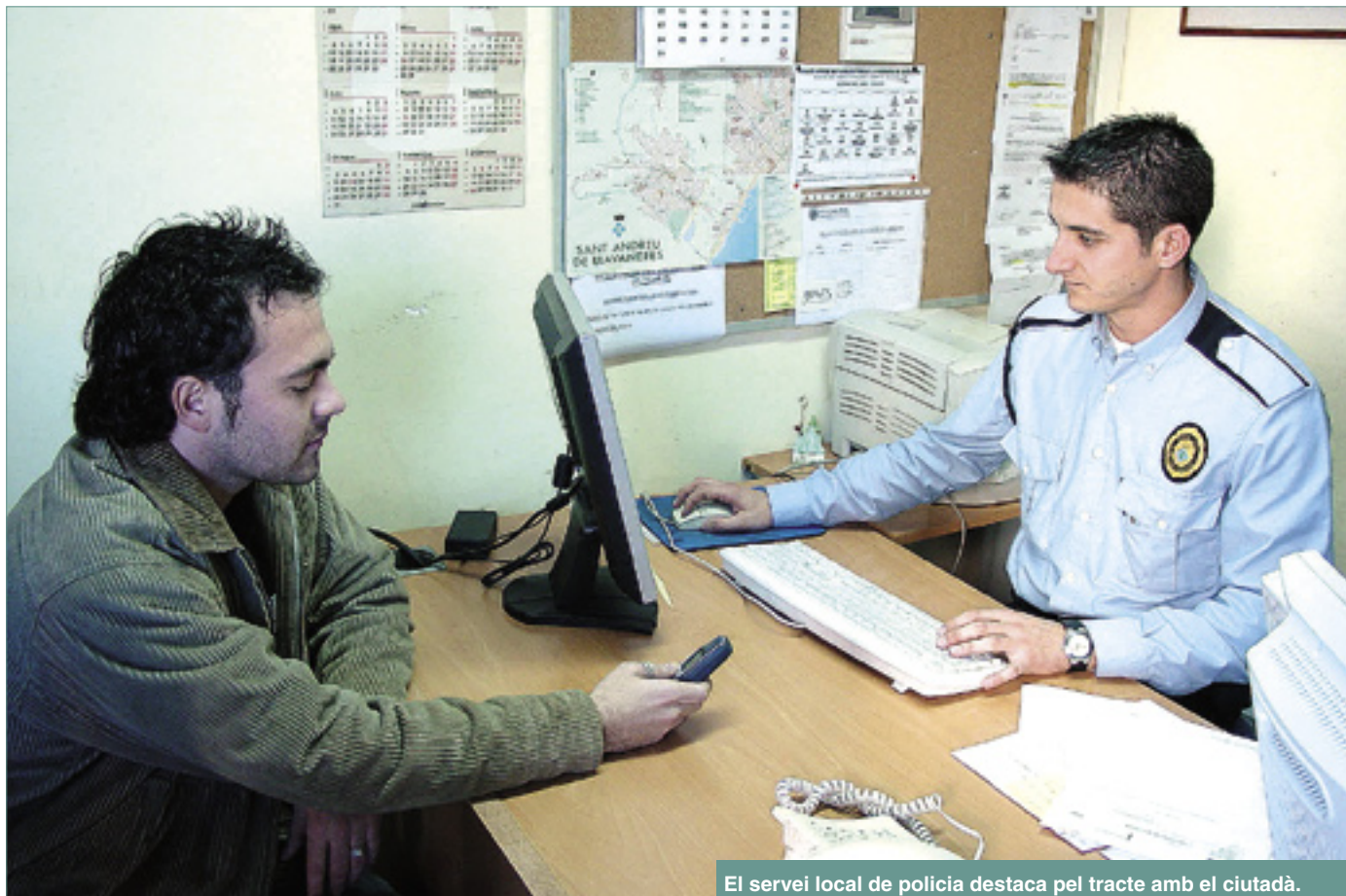
El servei local de policia destaca pel tracte amb el ciutadà.

Llanerres segueix sent un dels municipis més segurs de Catalunya. Els seus indicadors mostren com l'índex de delinqüència es troba per sota la mitjana espanyola i catalana. A més, la policia incrementa la seva dotació amb l'adquisició de dos vehicles nous.