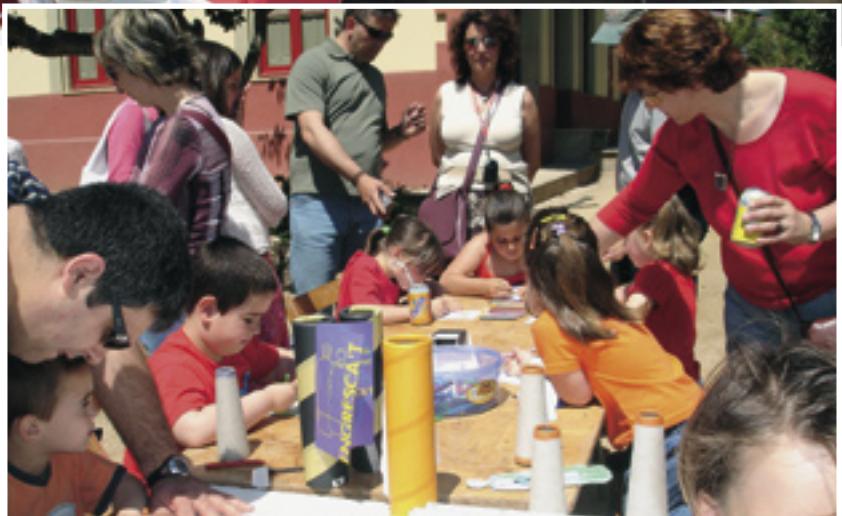
Els més menuts també van poder participar en diverses activitats de lleure.