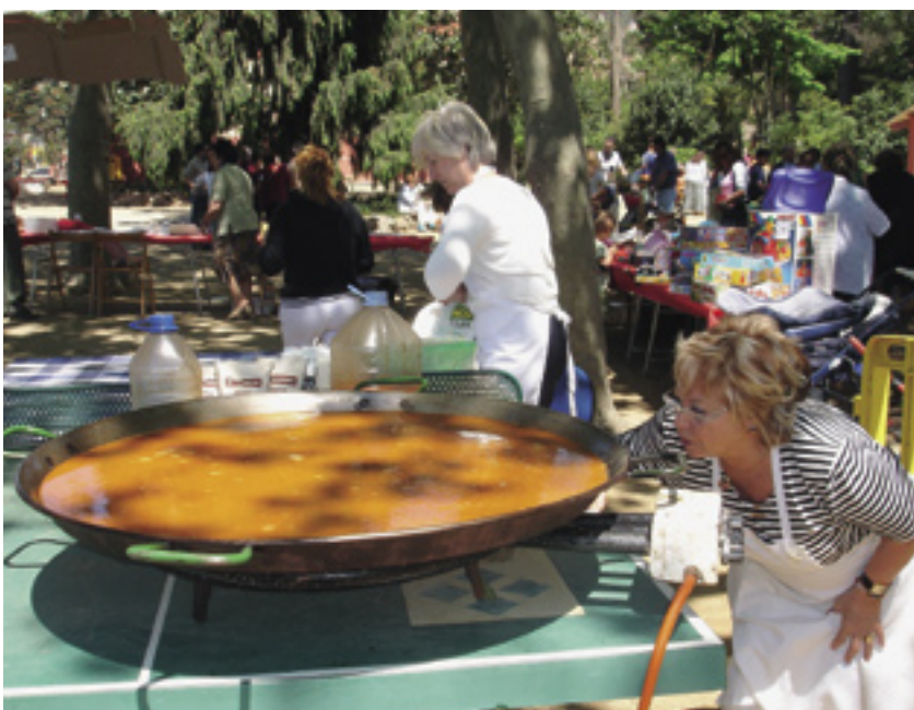
També va haver-hi lloc per a la gastronomia. A la imatge, una paella gegant.