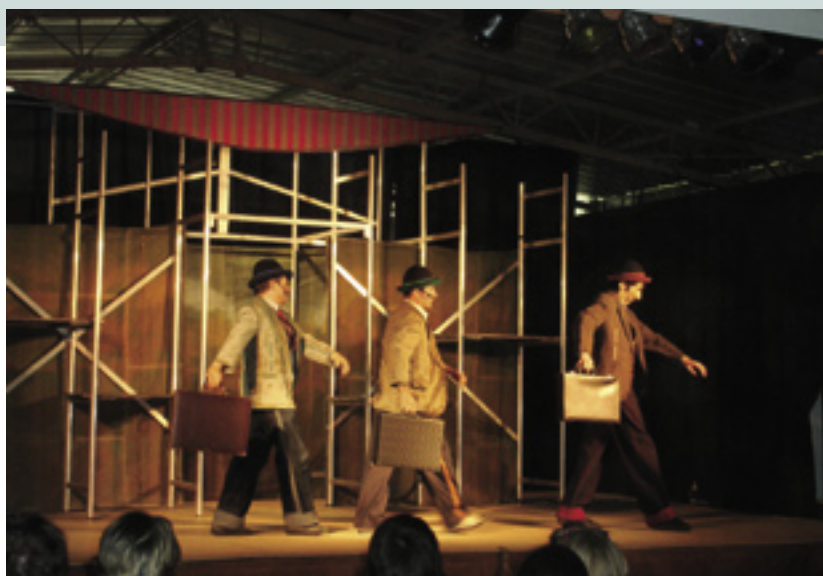
L'actuació de teatre va fer riure a grans i petits.