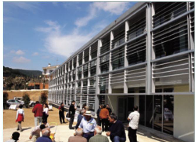
L'edifici aposta per la sostenibilitat i la integració en l'entorn.

Aproximadament mil tres-centes persones ja han visitat la nova Biblioteca Municipal del carrer Clòsens. Els responsables, però, preveuen que s'incrementi aquesta xifra a partir del setembre, quan es comencin a celebrar els actes programats per la biblioteca mateix.