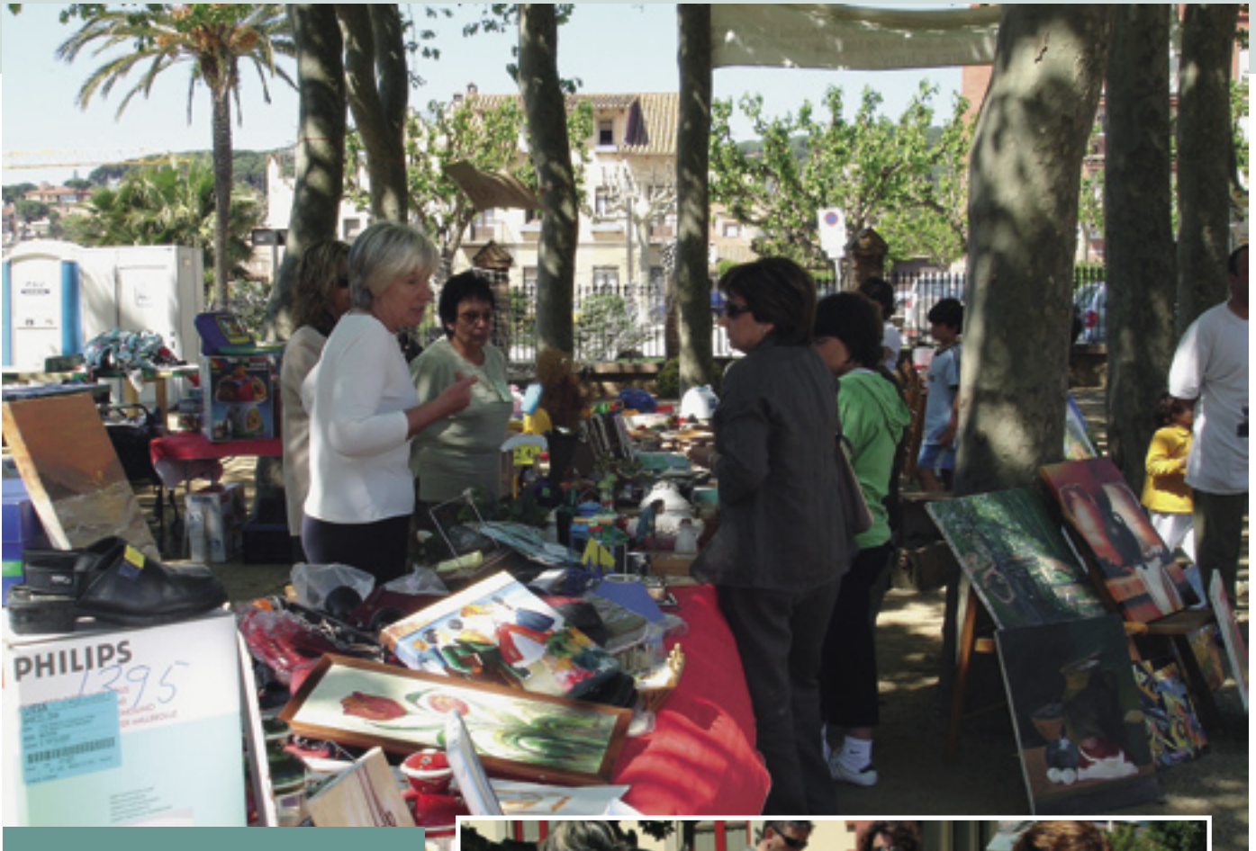
L'estand de Dona x la Dona va ser una de les més concorregudes.

El parc de Ca l'Alfaro de Llavanes va convertir-se en l'escenari d'una festa solidària els passats 7 i 8 de maig. Amb l'objectiu d'aconseguir fons econòmics per ajudar els afectats pel sisme marí a l'Àsia, des de les regidories de Benestar Social, Solidaritat i Cooperació, Cultura i Festes, Esports i Joventut, Promoció Econòmica, i diverses entitats relacionades amb la cultura, els esports i els serveis socials es van unir per celebrar aquestes jornades sota la crida Llavanes solidària: Tsunami .