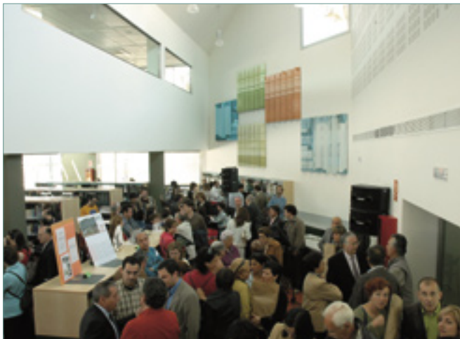
Els ciutadans van omplir la biblioteca el dia de la inauguració.