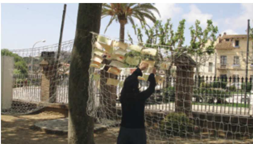
A la xarxa dels bons desitjos els ciutadans van poder expressar-se.