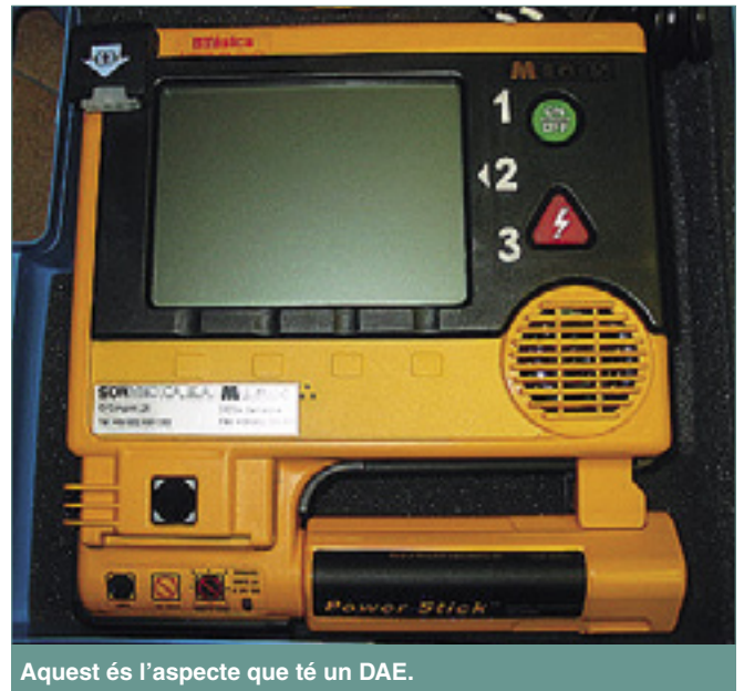
Aquest és l'aspecte que té un DAE.

o desfibril·lació o bé l'activa automàticament. En tots dos casos l'aparell avisa, mitjançant un altaveu, de les maniobres de suport vital bàsic mentre s'espera que arribi el personal del Sistema d'Emergències. “És útil que l'aparell incorpori un altaveu en el seu funcionament ja que agilitza i facilita una actuació més ràpida i eficaç que, en aquests casos, són criteris molt importants de complir per evitar conseqüències majors”, ha dit